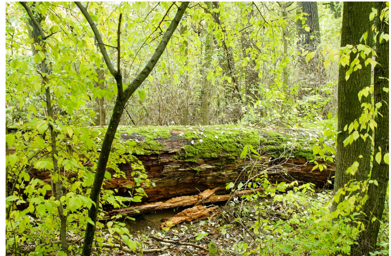
Rezerwat przyrody Morysin

https://pl.m.wikipedia.org/wiki/Plik:Rezerwat_przyrody_Morysin,_park_4.jpg